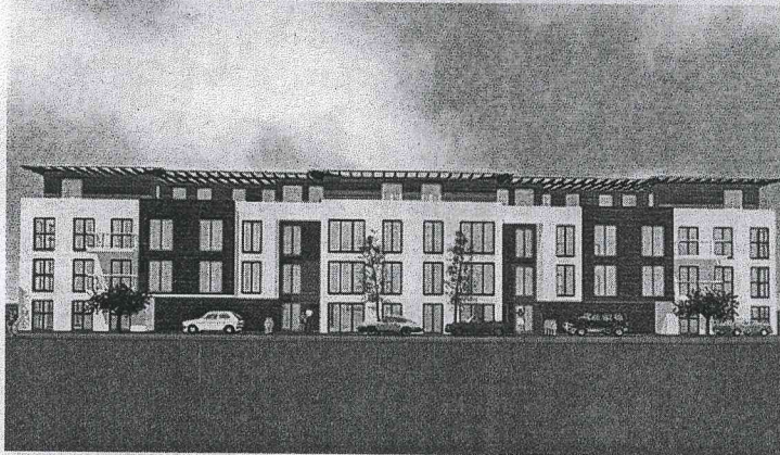
Ein Kindergarten (oben) und ein Wohn- und Geschäftshaus hat das Architekturbüro Rütten mit Kollegen fürs Mühlenfeld geplant. GRAFIK: STADT ERKELENZ

ten, im ersten und zweiten Obergeschoss wird sie behindertengerechte Wohnungen unterhalten. Weiterhin soll ein Bistro für ein gutes Ambiente sorgen.