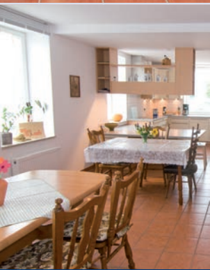
Tagespflege – für Mieter und Gäste von außerhalb

Geprägt durch den historischen Charakter und die liebevolle Renovierung, verfügt die Villa über einen besonderen Charme. Die einzelnen Wohnungen wurden behindertengerecht und besonders wohnlich hergerichtet. Notruf, Zimmerreinigung und häusliche Pflege können individuell nach Ihren Bedürfnissen abgerufen werden.