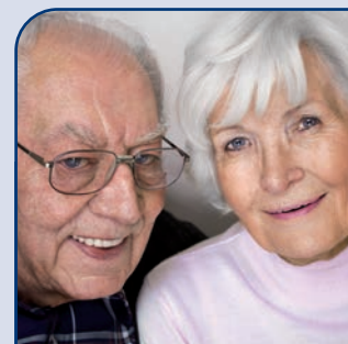
„Hier fühl ich mich wohl! Der nette Kontakt mit den anderen Gästen versüßt meinen Alltag!“

Ein solches Angebot – zumal es auch nach und nach angefordert werden kann – kann die Aufnahme in ein Alten- und Pflegeheim merklich hinauszögern oder sogar komplett vermeiden.