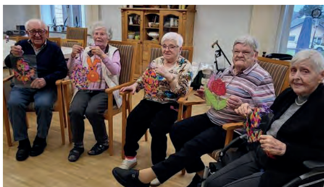
Hier zeigen unsere Bewohnenden stolz ihre gebastelten Fensterbilder

Das Kreativangebot ist bei uns im Haus "Am Waldrand" ein fester Bestandteil des Veranstaltungskalenders. Dabei kann es um jahreszeitangepasste Basteleien gehen, wie zum Beispiel darum, zu Ostern ansprechende Osterkörbchen hervorzuzaubern oder Dekorationen für die Wohnbereiche oder Laternen zu St. Martin. Der Soziale Dienst lässt sich hier immer etwas einfallen, um die Kreativität unserer Bewohnenden zu fördern.