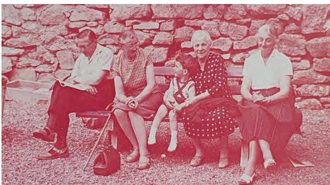
Eine Bank im Grünen hinterm Haus nannte sich schon Terrasse

Mir hat das Leben im Hotel immer gut gefallen, und ich wüsste keinen Gast, der schwierig gewesen wäre. Ich bin mit allen gut klargekommen. Die Ansprüche waren vielleicht auch nicht so hoch wie heute. Früher musste nicht alles so perfekt sein. Der persönliche Kontakt war den Leuten wichtiger als Komfort.