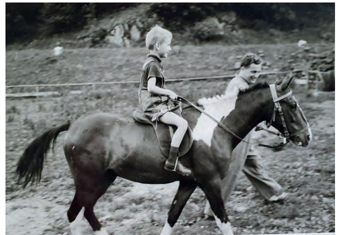
Die Kinder waren immer gut beaufsichtigt und lebten ein Abenteuer

Zum Hotel gehörte ein übersichtliches Gestüt mit zehn kleinen Ponys, auf denen die Kinder prima reiten konnten, und vier Pferde für die Erwachsenen. Damit war das Programm für die Urlauber gerettet. Auf dem Rücken eines Ponys durch die unberührte Natur zu reiten: Was will man mehr?