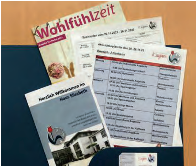
Die Begrüßungsmappe hält viele nützliche Infos bereit

In den ersten Wochen nach dem Einzug werden ein Biografiegespräch, ein Demenztest und eine Zufriedenheitsbefragung durchgeführt, damit wir den Neueinzug besser kennenlernen können und unsere pflegerische Unterstützung und die Angebote des Sozialen Dienstes ganz individuell zuschneiden können.