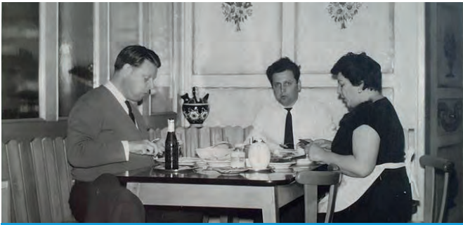
Das Ambiente im Hotel Illmühle war von gehobenem Niveau

einquartiert und machten Urlaub mit den Ponys. Die Eltern setzten sie einfach nur bei uns ab, sie tranken nicht mal einen Kaffee bei uns, aber wussten die beiden gut untergebracht. Meine Frau, ich und das Kindermädchen kümmerten uns um alles.