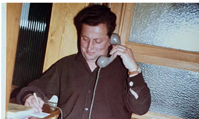
Die Buchungen wurden auch vertrauensvoll am Telefon entgegengenommen

Im Sommer war unser Hotel ausgebucht. Viele buchten schon direkt für den nächsten Sommer. Im Winter war es etwas ruhiger, aber das war für uns, nach den Anstrengungen im Sommer, Entspannung pur. Wir hatten ein gut geführtes Haus, sonst wären die zahlungskräftigen Urlaubsgäste, darunter viele Ärzte und Akademiker, nicht immer wieder gekommen.