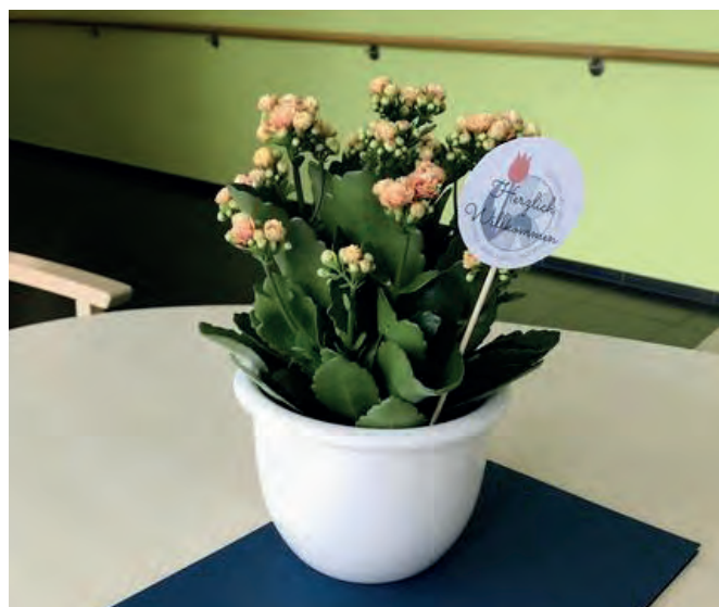
Blumen sagen mehr als Worte: der Willkommensgruß, der von Herzen kommt