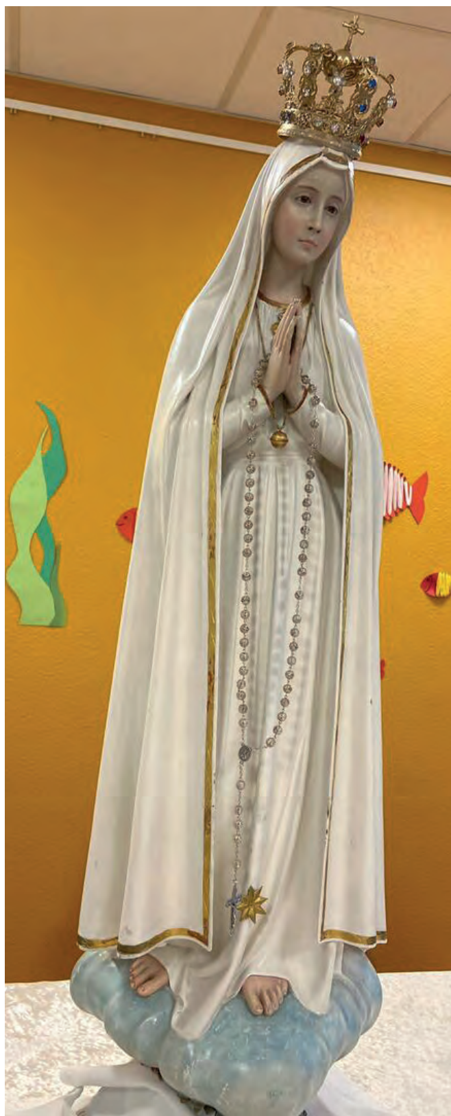
Die Fatima Pilgermadonna bei uns in der Tagespflege Wassenberg

Jedes Lassen, jede Tat, Mutter Dir vom guten Rat, leg ich alles in die Hände, Du führst es zum rechten Ende! Amen.