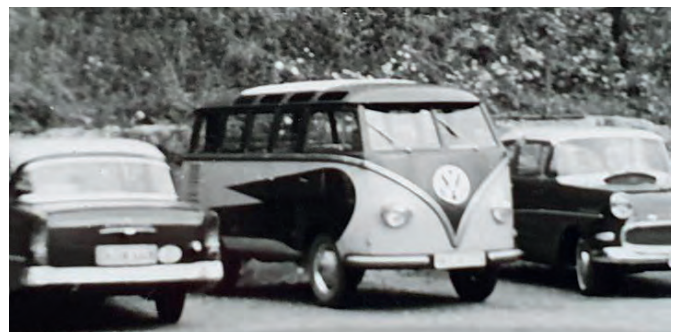
Für einen Tagesausflug mit meinem VW-Bus blieb sogar der Mercedes stehen

Ein Gast, er war Direktor von Thyssen Düsseldorf, buchte oft für fünf, sechs Wochen die Ferienwohnung in Hinterzarten. Seine Frau sagte immer: "Mein Mann hat so viel Geld, das kriegt der gar nicht verbraucht." Sie wurden vom Chauffeur gebracht, der mit dem Zug wieder zurückfahren musste. An den Abenden zeigten meine Frau und ich dem Ehepaar die besonderen Restaurants der Umgebung und er lud uns zum Essen ein. Er gab mal eben so hundert Euro Trinkgeld. Und sogar das Taxi übernahm er. Er wollte nicht, dass ich mein Auto für ihn anpackte. Sein eigenes Auto stand sowieso nur da und wartete auf den Chauffeur.