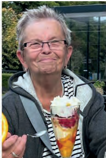
Reise nach Domburg