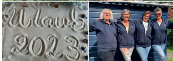
Erholung pur im Chalet