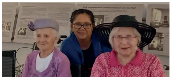
Die Hüte waren Freude bringende Accessoires an diesem Nachmittag

Die Gesamtkosten von 160 Euro, alles inklusiv, haben sich definitiv gelohnt. (ml)