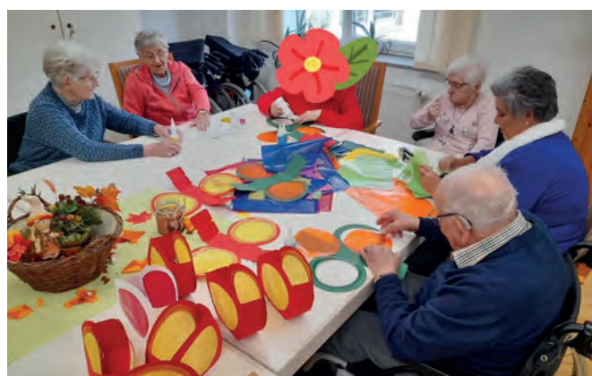
Unsere „Kreativtruppe“ voll konzentriert beim Laternenbasteln zu St. Martin

Malen und basteln fördert Kommunikation und Kontaktaufnahme ebenso wie die räumliche Orientierung, die bildliche Erinnerung und die visuelle Wahrnehmung. Es stärkt die Konzentration und bringt motorische Prozesse ins Gleichgewicht, verbessert die Körperwahrnehmung und bremst innere Unruhe, führt zur Entspannung und vermittelt Erfolgserlebnisse. (hs)